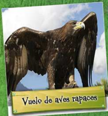
Vuelo de aves rapaces

Todo ello en un entorno recreado al detalle con la arquitectura y ambientación típicas de los lugares más pintorescos de América, Asia y Europa. El parque ideal para toda la familia. ¡No te lo puedes perder!